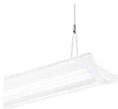
IQ Wave suspendu