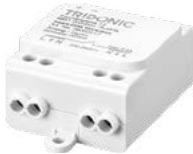
basicDIM Wireless Repeater pour augmenter la portée ou pour intégrer des interrupteurs muraux classiques existants