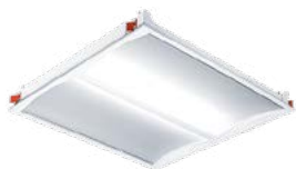
IQ Wave encastré