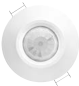
Capteur basicDIM sans fil pour la présence et la lumière ambiante